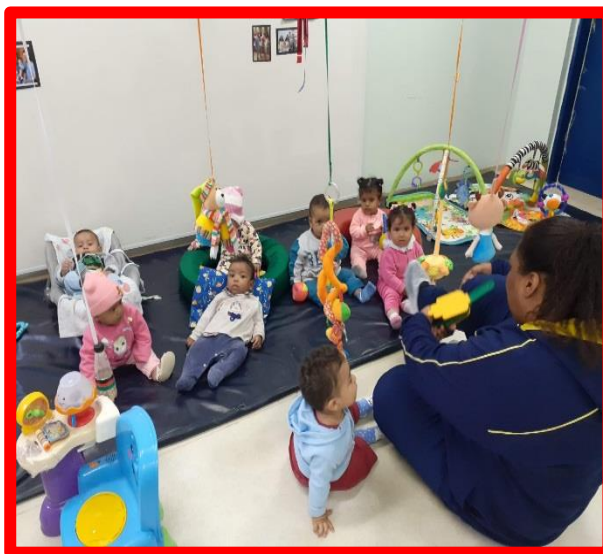
Momento Orinha no Berçário I

Obrigado, senhor, você é bondoso E seu amor dura eternamente. Amém