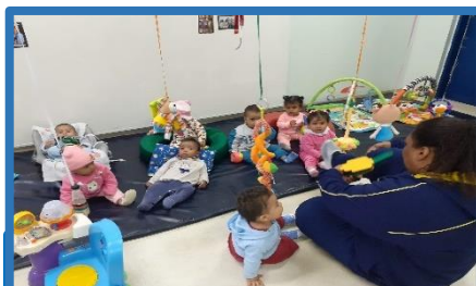
MOMENTO ORINHA COM A PROFESSORA