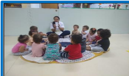
MOMENTO ORINHA COM A PROFESSORA