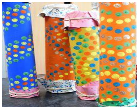
Pau de chuva