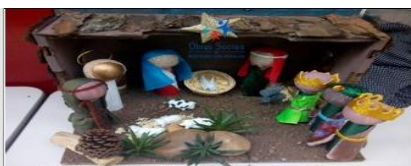
CALENDÁRIO DO MÊS DE DEZEMBRO 2020