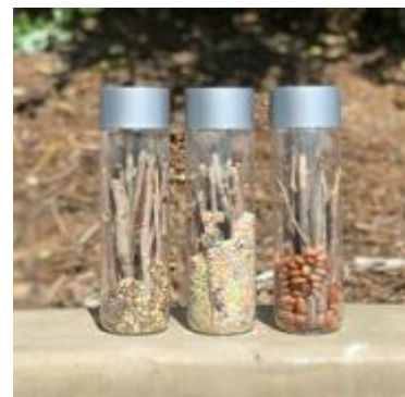
Pau de Chuva

https://br.pinterest.com/search/pins/?q=Instrumentos%20musicais