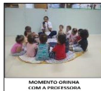
MOMENTO ORINHA COM A PROFESSORA