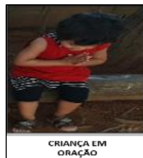
CRIANÇA EM ORAÇÃO