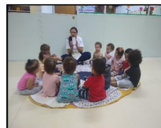
MOMENTO ORINHA COM A PROFESSORA