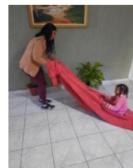
CARRINHO COM LENÇOL