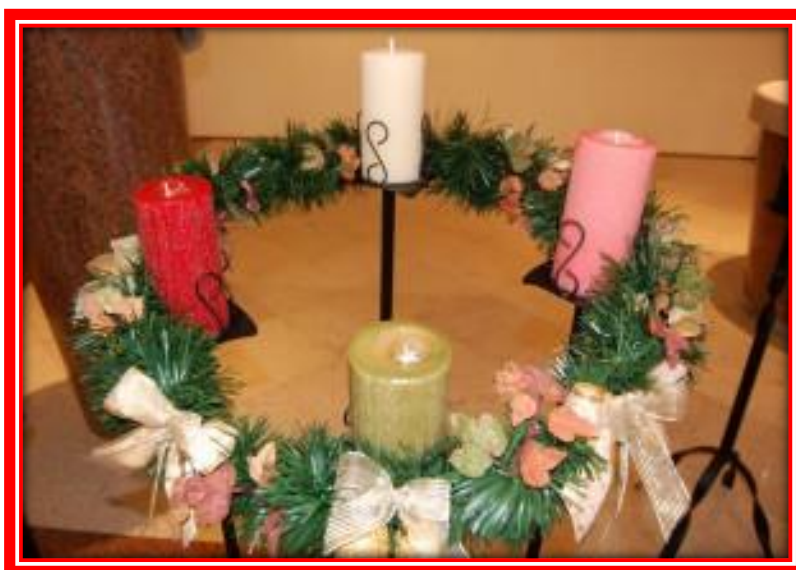
A coroa do advento.

As velas deverão ser acessas a cada domingo que antecede o Natal.