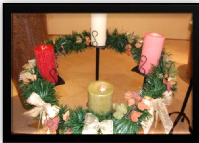
A coroa do advento.

porque nos deu a salvação. Deus ao enviar o seu Filho demonstra o grande amor que Ele tem por nós.