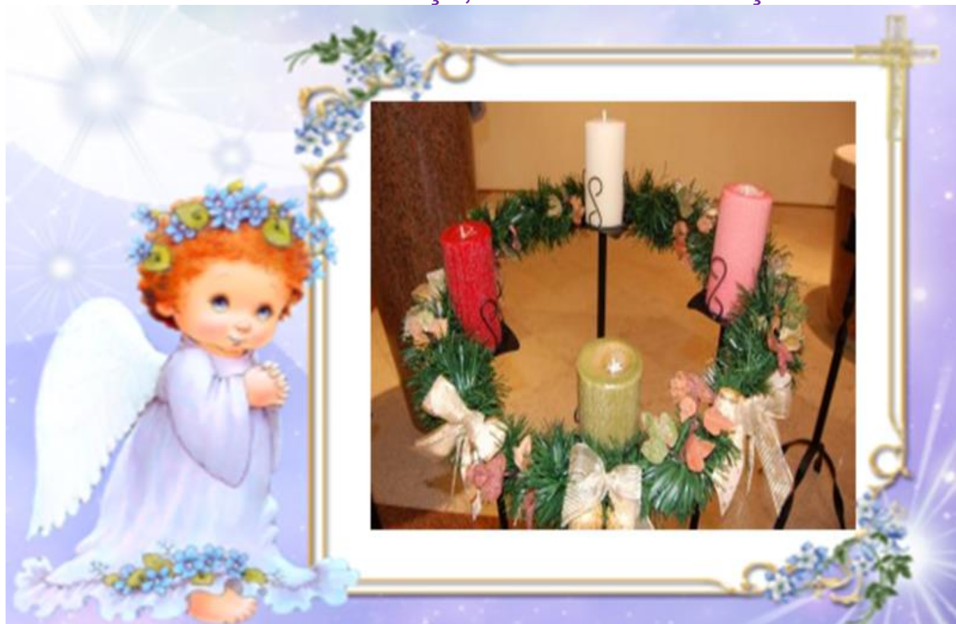
A coroa do advento.

As velas deverão ser acessas a cada domingo que antecede o Natal