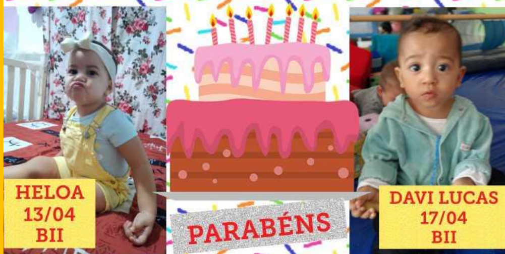
HELOA 13/04 BII